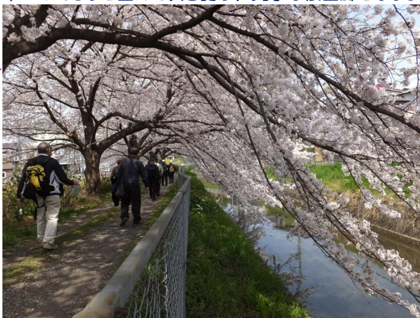
見沼代用水 西縁の桜