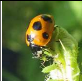
ナナホシテントウ

テントウムシは成虫で越冬する。 ナナホシテントウは春早くの暖かい日に出てくるので春を告げる虫として好まれる キイロテントウは植物につくカビを食べる