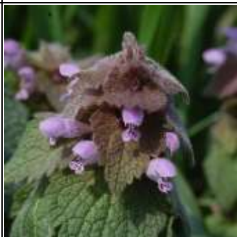
ヒメオドリコソウ

春一番に花をつけるのは青や紫の花。光の波長が長い色で遠くから虫に見つけてほしいから。 オオイヌノフグリはほかの草が伸びる前に青いじゅうたんを広げる。 ノボロギクはアスファルトの隙間から伸びて花をつける