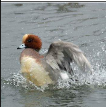
ヒドリガモ水浴び