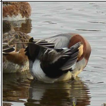
尾脂線から油を塗る

羽の手入れ ←←朝ごはんが終われば翅の手入れ。まず羽を大きく動かして汚れや虫を落とすそのあと、尾脂線から出る油を塗り付け羽の撥水加工羽の間に空気をためて浮力を得る →夏の間たんぼなどで子育てしていたカルガモも集まる