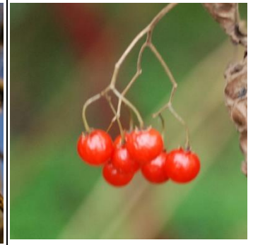
ヒヨドリジョウゴ