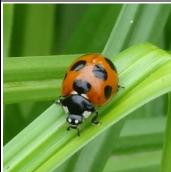
ナナホシテントウ

成虫越冬の昆虫たち ←ナナホシテントウは集団越冬するそうなの。 →キタテハは翅を閉じると枯れ葉にそっくり →クビキリギスも成虫越冬 ↓カモたちは冬越しのためにやってくる