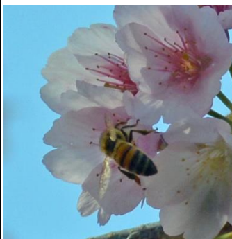
セイヨウミツバチ