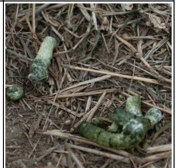
ヒドリガモ うんち