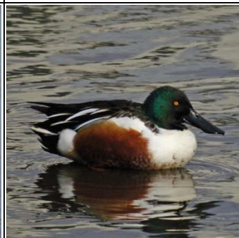
ハシビロガモ オス